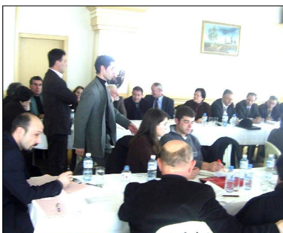
Prishtinë, 16 janar 2006