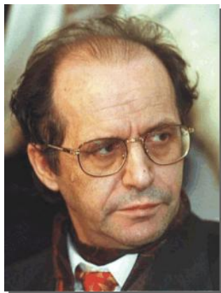
Presidenti i Kosovës Dr.Ibrahim Rugova 1944 - 2006