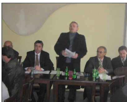
Skenderaj, 18 janar 2006