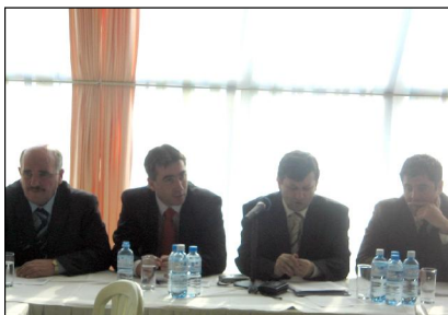
Prishtinë, 16 janar 2006

Komunat e Kosovës pas zgjedhjeve të ardhshme do të duken ndryshe si në numër ashtu edhe sa i përket dokumenteve rregullative. Për këtë duhet të përgatiten këshilltarët komunalë që të ushtrojnë rolin e tyre karshi detyrave dhe përgjegjësiive. Komuna e Prishtinës në kuadër të organizimit