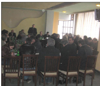
Skenderaj, 18 janar 2006

të ardhshëm të pushtetit lokal do të ketë një status të ri e të ndryshëm nga komunat tjera meqë kjo për kryeqytetet është e regulluar në formë të veçantë edhe në shtetet tjera. Në fund dua të shtoj se sa i përket këtij projekti që ne sot po fillojmë implementimin etij dua të theksoj se përfituesit kryesor do të jenë këshilltarët komunalë të Komunave të Kosovës. Ky projekt do të realizohet vetëm për antarët e rinj të KK-ve të cilët do të fillojnë punën pas zgjedhjeve të ardhshme komunale. Projekti në fjalë përban tri komponente.