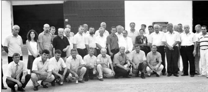
NGA VIZITA NE LAC: Kompania e grumbullimit, përpunimit dhe eksportimit të bimëve medicinale dhe eterovajore "Filipi"