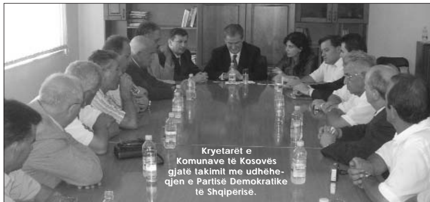
Kryetarët e Komunave të Kosovës gjatë takimit me udhëheqjen e Partisë Demokratike të Shqipërisë.

Vlen të ceket se një vizitë e tillë dhe takimet e kryetarëve të komunave të Kosovës dhe të Bashkive të Shqipërisë me sipërmarrësit privat lokal si dhe promovimi i produkteve mbarëkombëtare është planifikuar të mbahet në fillim të vitit të ardhshëm në Kosovë.