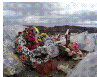
Varrezat e Gjakovës