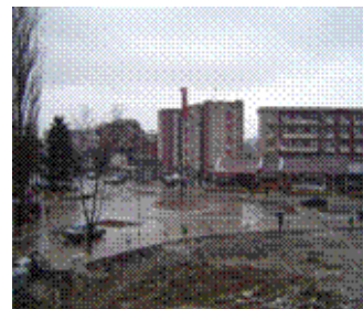
Sheshi në qendër të Deçanit

vendet publike është përpiluar deklarata parimore e cila pret aprovimin nga Bordi i AKK-së.